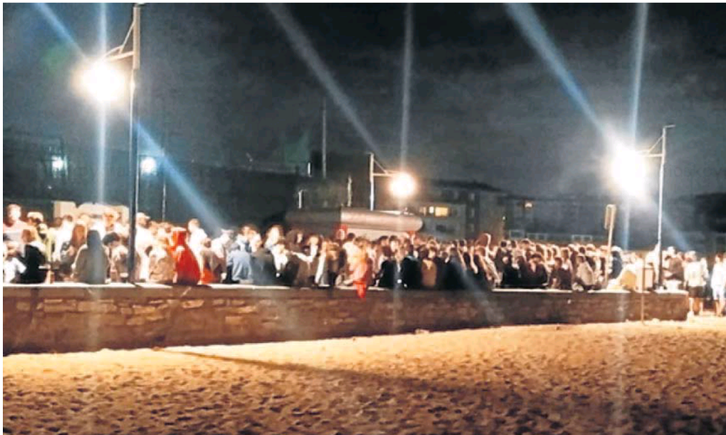
Más de 200 jóvenes se reunieron en la noche del viernes al sábado en el paseo de la playa de Plentzia, convertido en 'botellódromo'. JON ANDER GOITIA