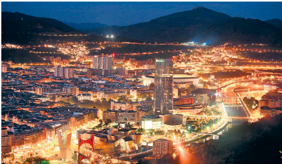
Espectacular imagen de Bilbao durante la noche donde se aprecia la gran iluminación. JORDY ALEMANY