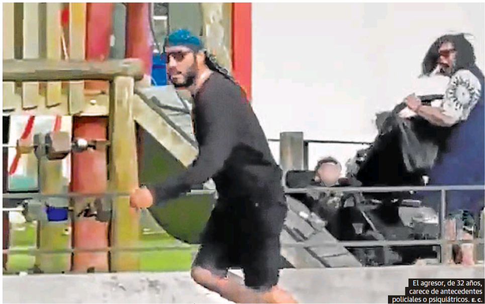
El agresor, de 32 años, carece de antecedentes policiales o psiquiátricos. e.c.

Erkoreka se muestra dispuesto a negociar el convenio y Ortzuzar califica las protestas de «algaradas» P17