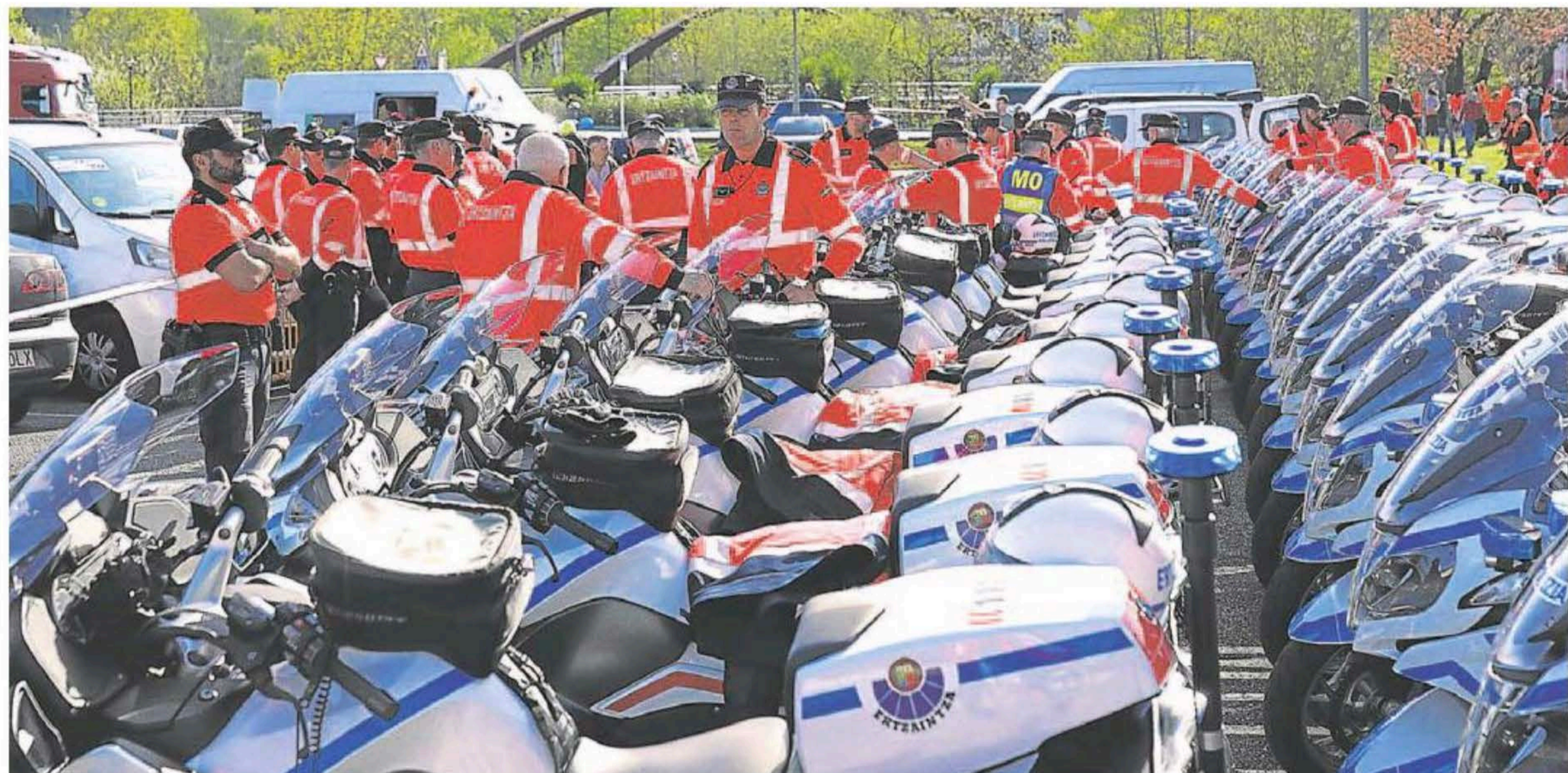
Imagen del dispositivo policial organizado en la Itzulia, la vuelta ciclista al País Vasco. MANU CECILIO