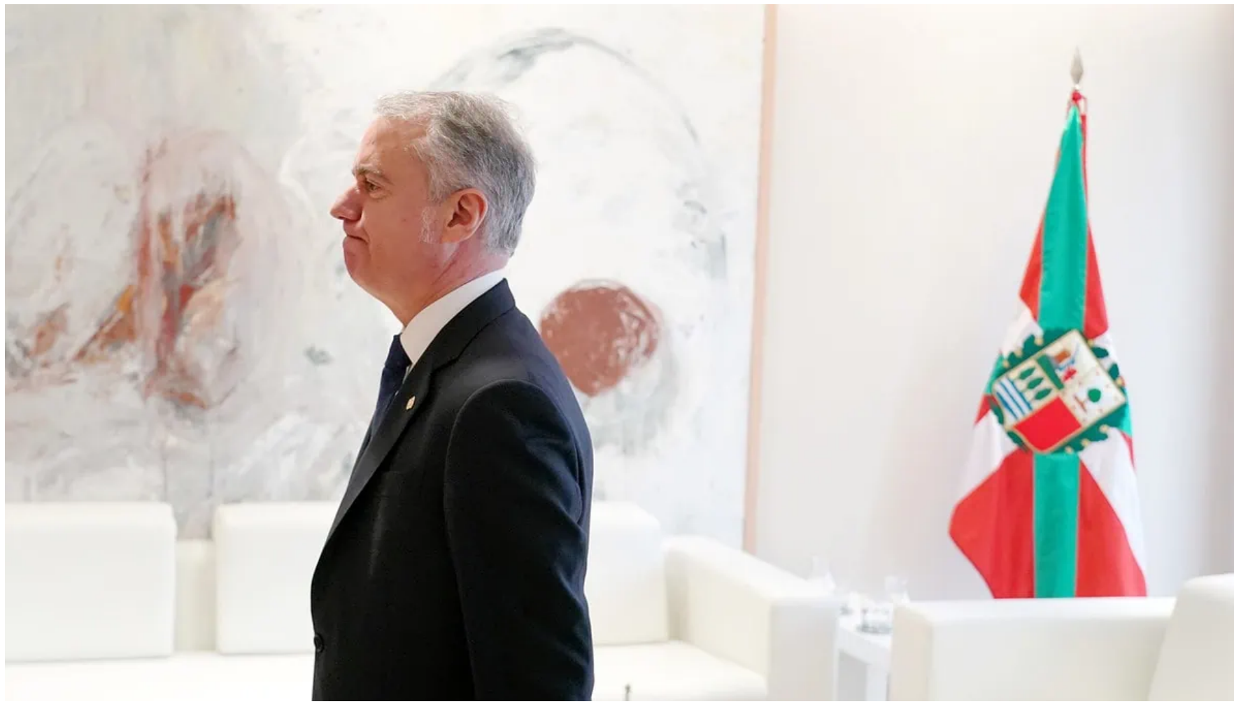
El lehendakari Iñigo Urkullu

Los sindicatos desconfían de la promesa del lehendakari sobre una inminente oferta de mejoras laborales. «Seis días después, no sabemos nada», advierten