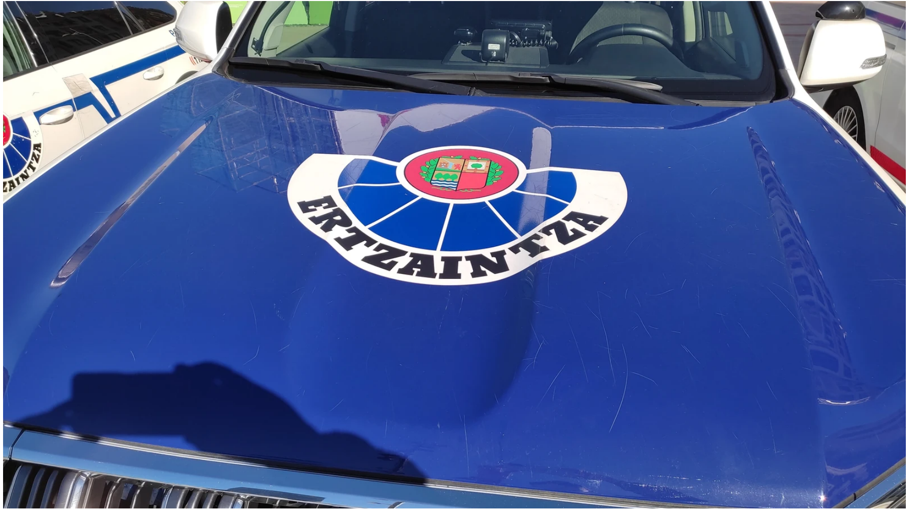
▲Vehículo de la Ertzaintza

Chalecos antibales y eliminación de las patrullas unipersonales, son otras de las medidas propuestas