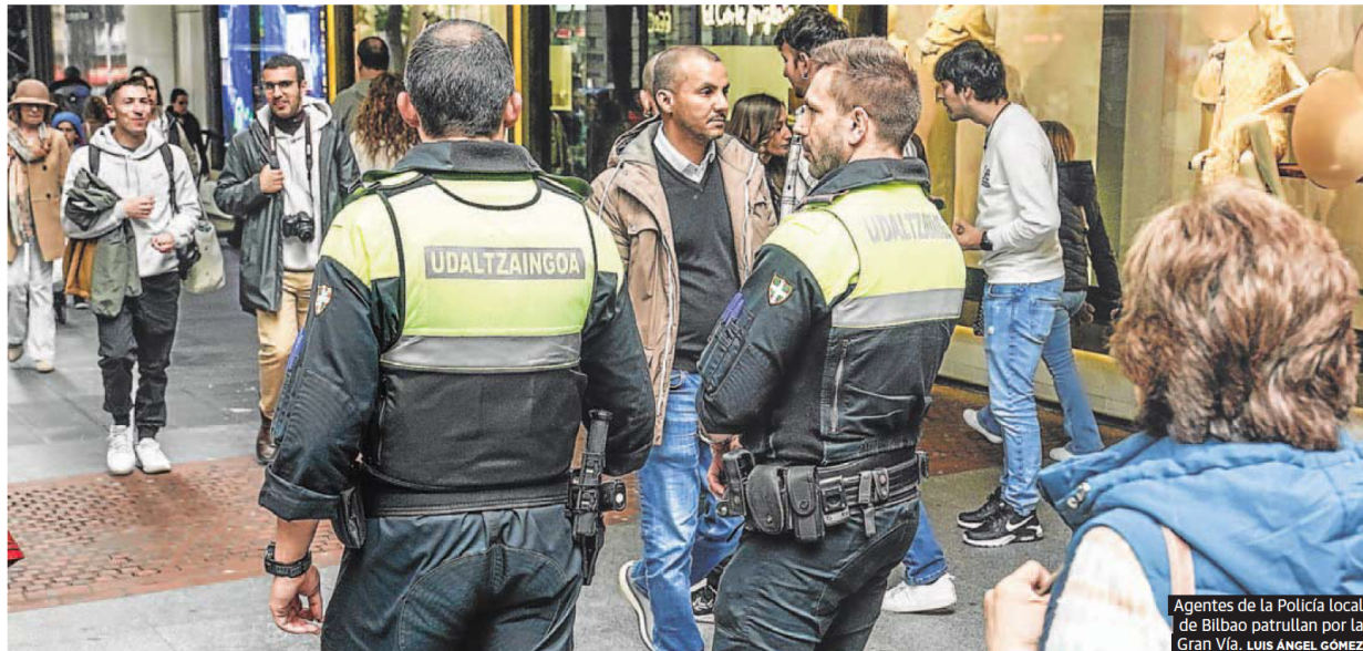
Agentes de la Policía local de Bilbao patrullan por la Gran Vía. LUIS ÁNGEL GÓMEZ