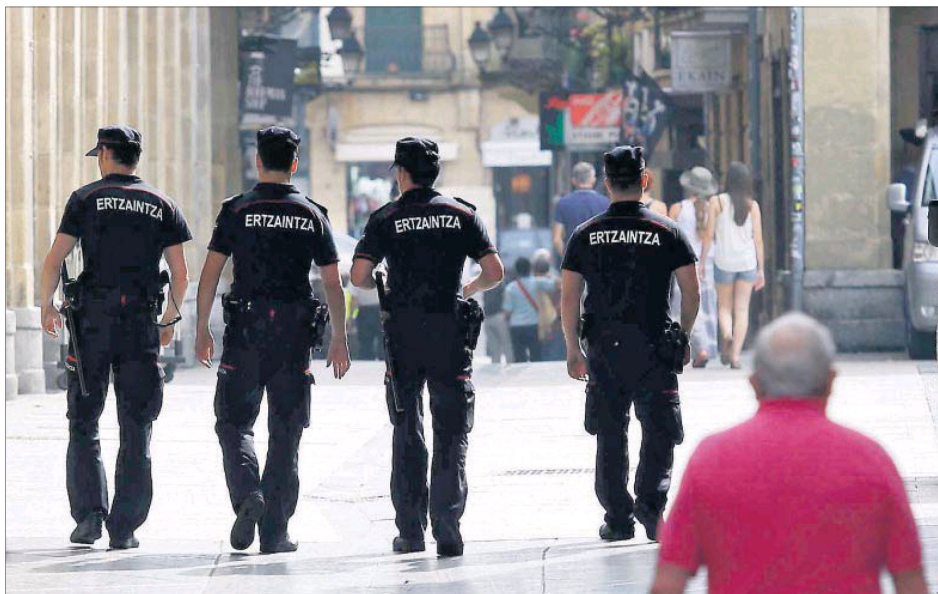
Agentes de la Ertzaintza patrullan las calles de la Parte Vieja de San Sebastián.