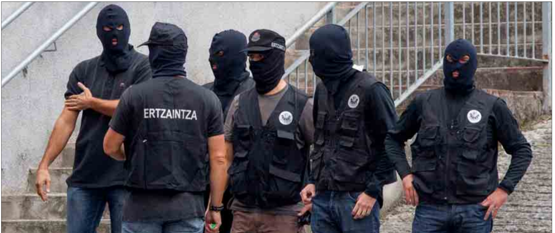
Agentes de los servicios de información de la Ertzaintza en una operación antiterrorista.