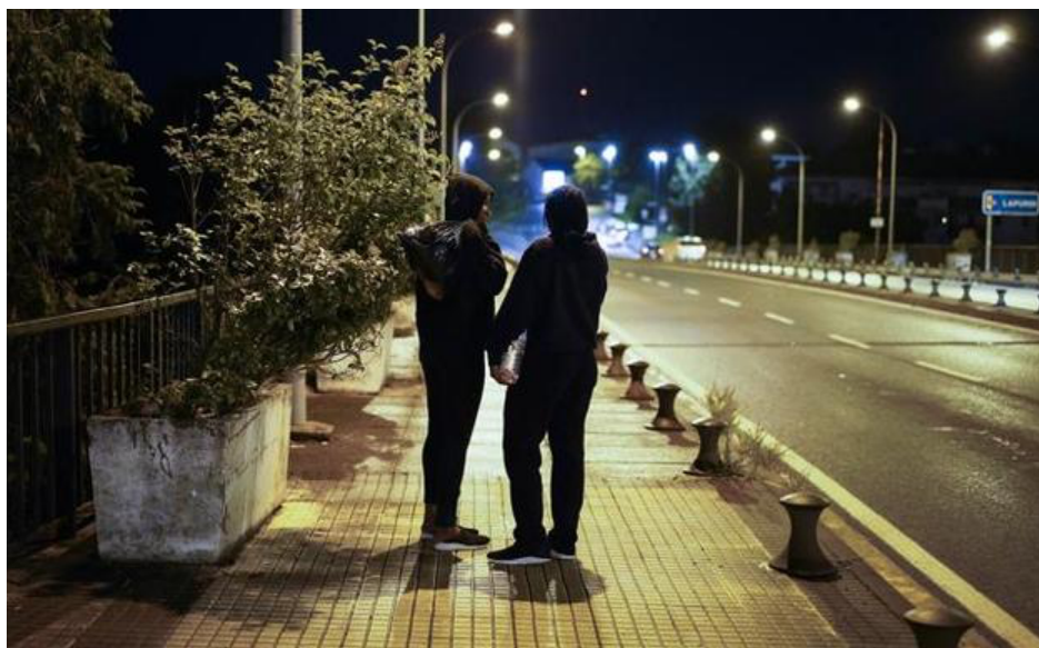
Inmigrantes africanos en Irun esperando a pasar a Francia.

El sindicato afirma que labores como la identificación de menores requiere una dedicación que no pueden cubrir los agentes actuales