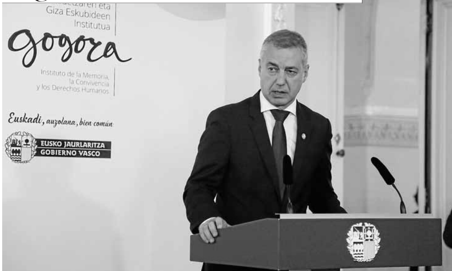
El lehendakari, Iñigo Urkullu, en la celebración del Día de la Memoria.