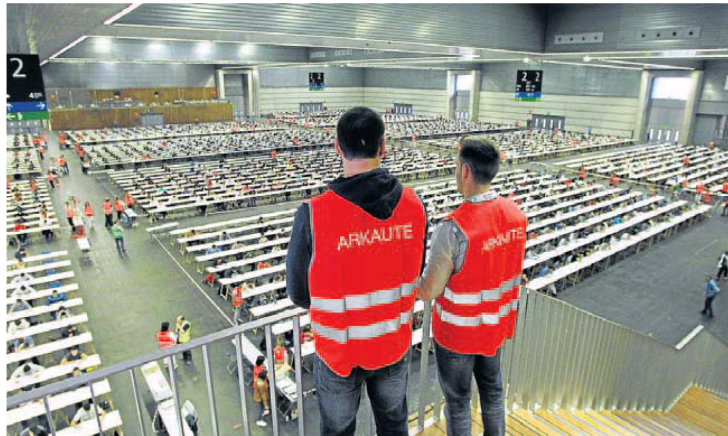
Dos profesores de Arkaute observan las pruebas de acceso a la Ertzaintza en el BEC de Barakaldo.

El sindicato Erne, por su parte, considera que «el futuro» de la Ertzaint-