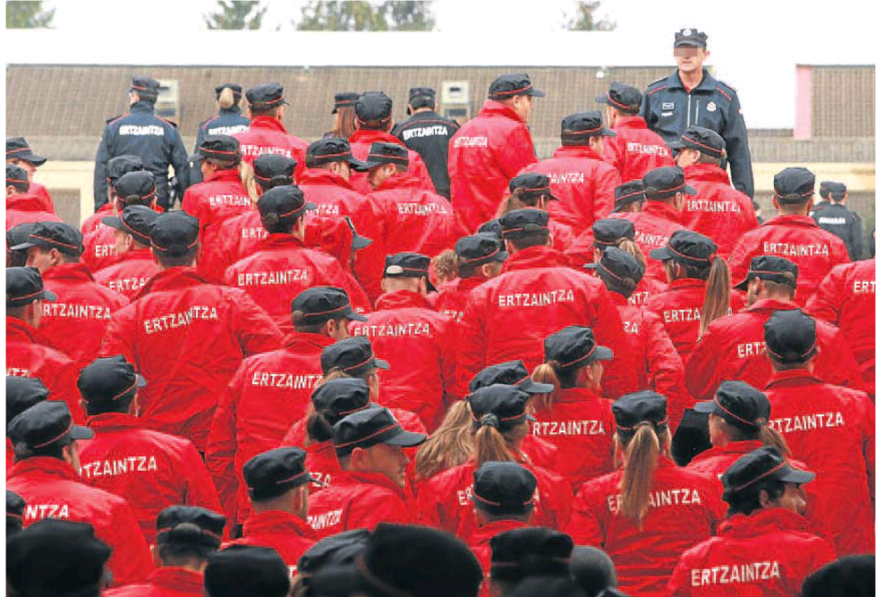
Imagen del inicio del curso formativo de los agentes de la 27 promoción, que saldrán a la calle el próximo julio.

Hay datos que hablan por sí mismos. El torrente de jubilaciones se ha mantenido relativamente sostenido en los últimos años. Entre 2012 y 2017 colgaron la placa 655 ertzainas. El proceso se ha acelerado entre 2018 y este año, cuando se han retirado -o están a punto de hacerlo- 576 agentes. Un importante número de bajas que, en todo caso, no guarda parangón con lo que está por venir. En los próximos seis años están previstas las jubilaciones de otros 2.700 agentes. En 2020, por ejemplo, se marcharán 416 funcionarios. El pico más alto se alcanzará en 2024, con 481. A estas cifras hay que añadir, además, las más de 50 bajas anuales que se producen por fallecimientos, incapacidades laborales y renun-