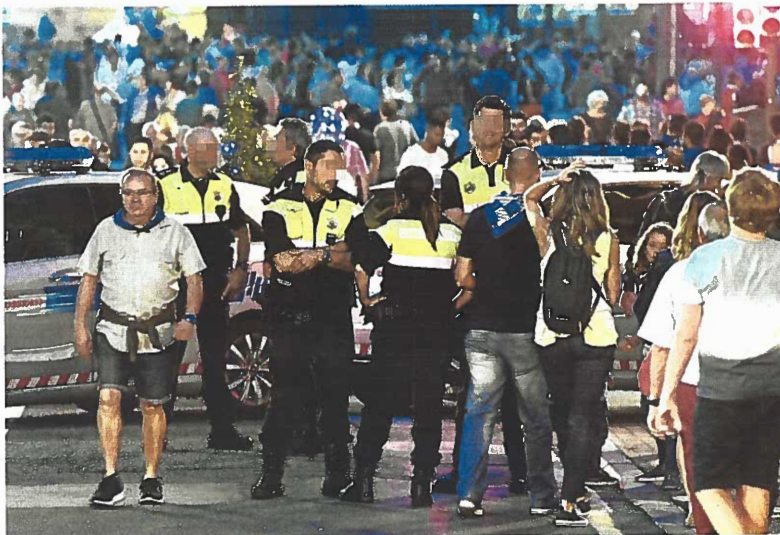
Un total de 47 municipios vascos, entre ellos Bilbao, recurren a policías interinos, especialmente en verano.

«Ponemos fin a la precariedad. Se deben convocar más OPE»