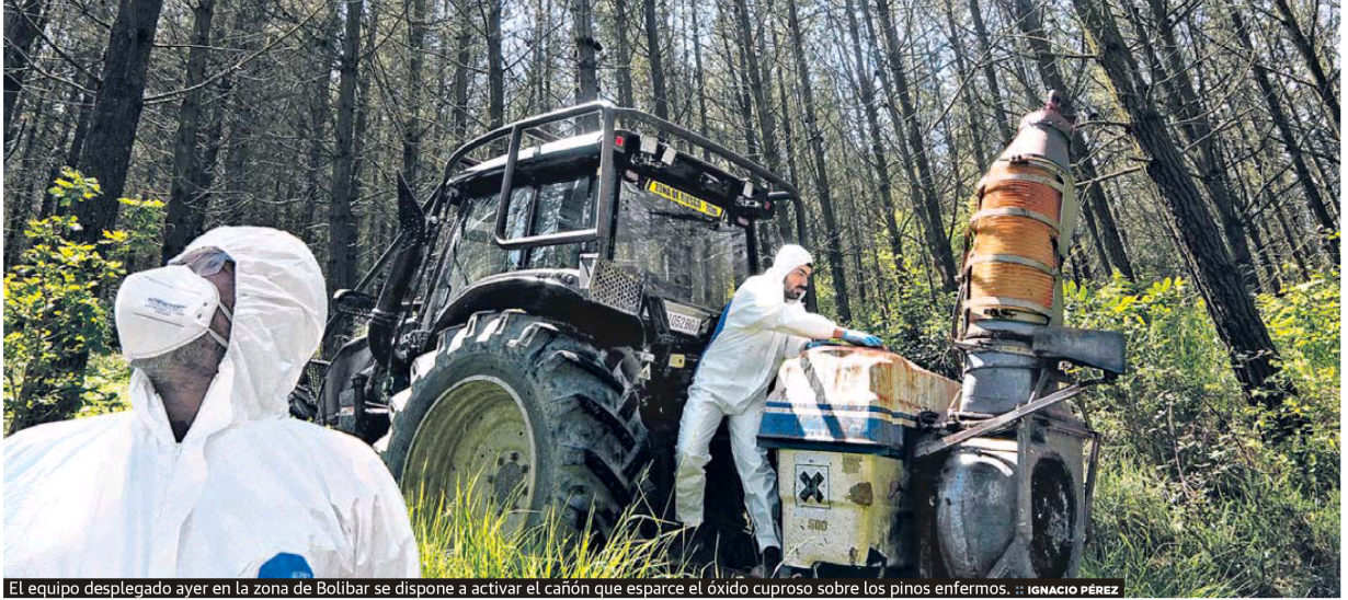
El equipo desplegado ayer en la zona de Bolibar se dispone a activar el cañón que esparce el óxido cuproso sobre los pinos enfermos.

La Diputación envía a 232 forestalistas a esparcir ácido cuproso mezclado con agua sobre un total de 1.240 hectáreas de Bizkaia afectadas por la enfermedad P8