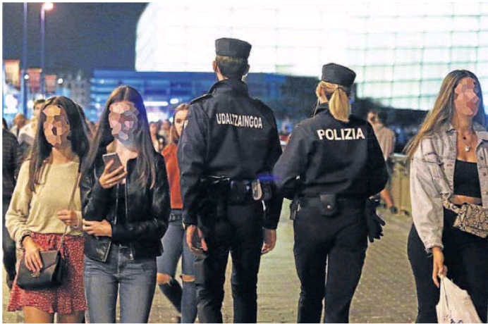
Una pareja de agentes de la guardia urbana donostiarra de patrulla.

Desde la central aseguran que esta situación ha provocado la «profunda indignación» de las futuras policías, así como el «apoyo y solidaridad de todos sus compañeros», que se han negado a ponerse la ropa deportiva facilitada hasta que no se dé una solución,