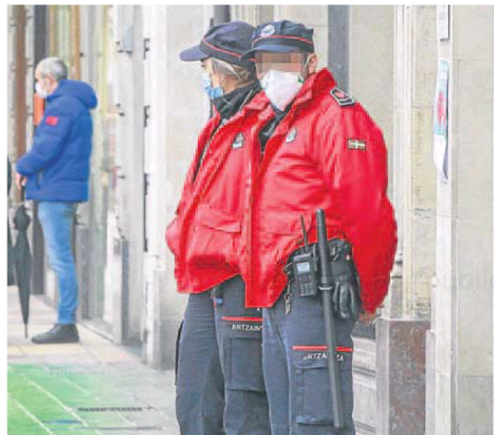
Dos agentes de la Ertzaintza, de patrulla en la calle. BLANCA CASTILLO

Destacaba su habilidad para persuadir y dotes de negociador incansable