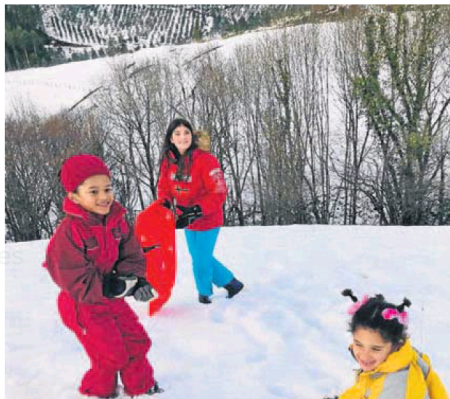
Los nietos del matrimonio juegan en las laderas cercanas al caserío.