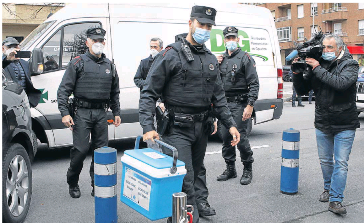
Agentes de la Ertzaintza transportan vacunas contra el coronavirus a una residencia de Vitoria.

En la reunión de hoy ERNE exigirá que se inyecte a todos los 7.300 agentes que componen el cuerpo. También a los 2.000 que superan los 55 años que marcan