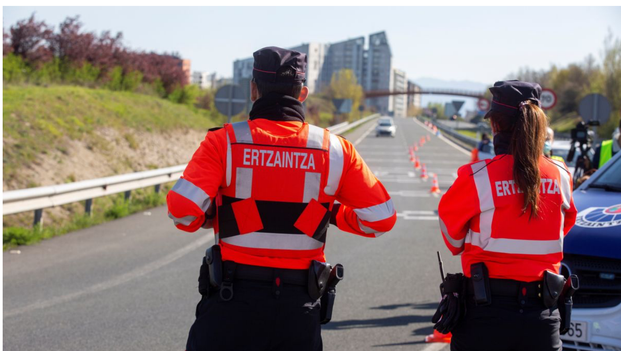
Agentes de la Ertzaintza

Erne, Euspel y ELA cargan contra el pacto y contra el sindicato "amigo" del Gobierno